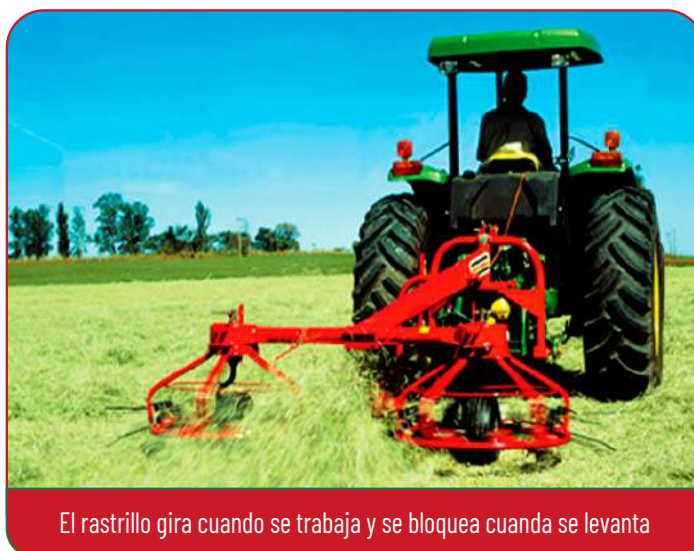
El rastrillo gira cuando se trabaja y se bloquea cuando se levanta